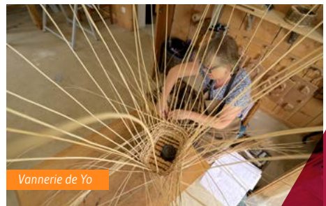
Vannerie de Yo