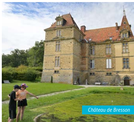
Château de Bresson