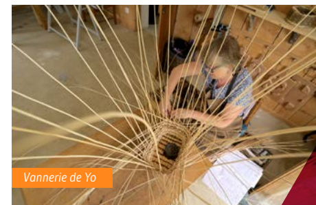
Vannerie de Yo