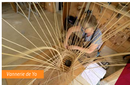
Vannerie de Yo