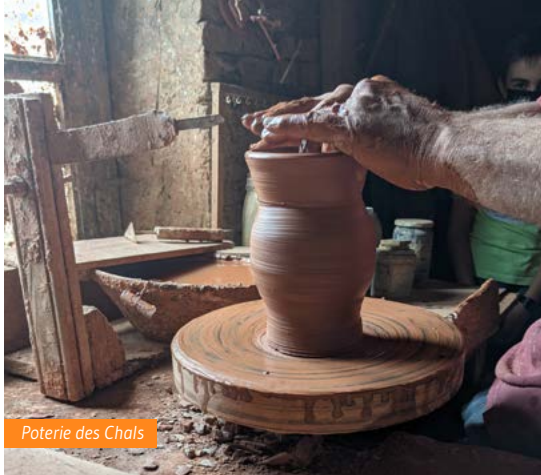
Poterie des Chals