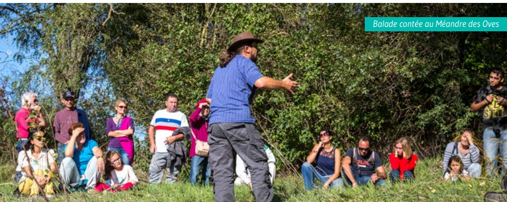
Balade contée au Méandre des Oves