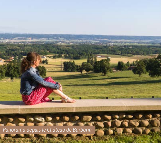
Panorama depuis le Château de Barbarin