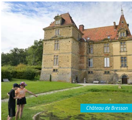
Château de Bresson